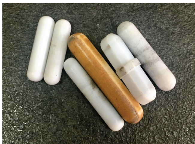
Slika 2 – Nekolicina upotrijebljenih PTFE miješala s različitim stanjima površine

Pod uvjetima Birch-Billupsove redukcije dolazi do defluorinacije PTFE-a, uzrokujući pri tomu crno obojenje magnetskog miješala, te nastanka fluoridnih aniona, alkilnih radikala i olefina. Alkilni radikali na površini miješala nastali Birch-Billupsovom redukcijom