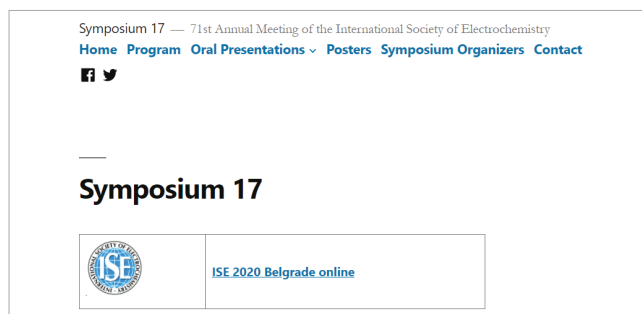
Slika 4 – Mrežna stranica Symposium 17

Iskustva stečena tijekom organizacije ovog skupa su dragocjena, mogu poslužiti u organizaciji nekih budućih on-line ili hibridnih skupova te svakako predstavljaju prekretnicu u konceptu ISE skupova.