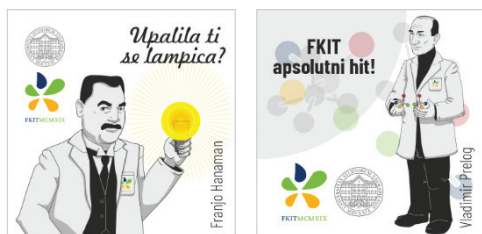
Slika 4 – Magnetići koji su se dijelili kao dio promotivnih materijala Fakulteta