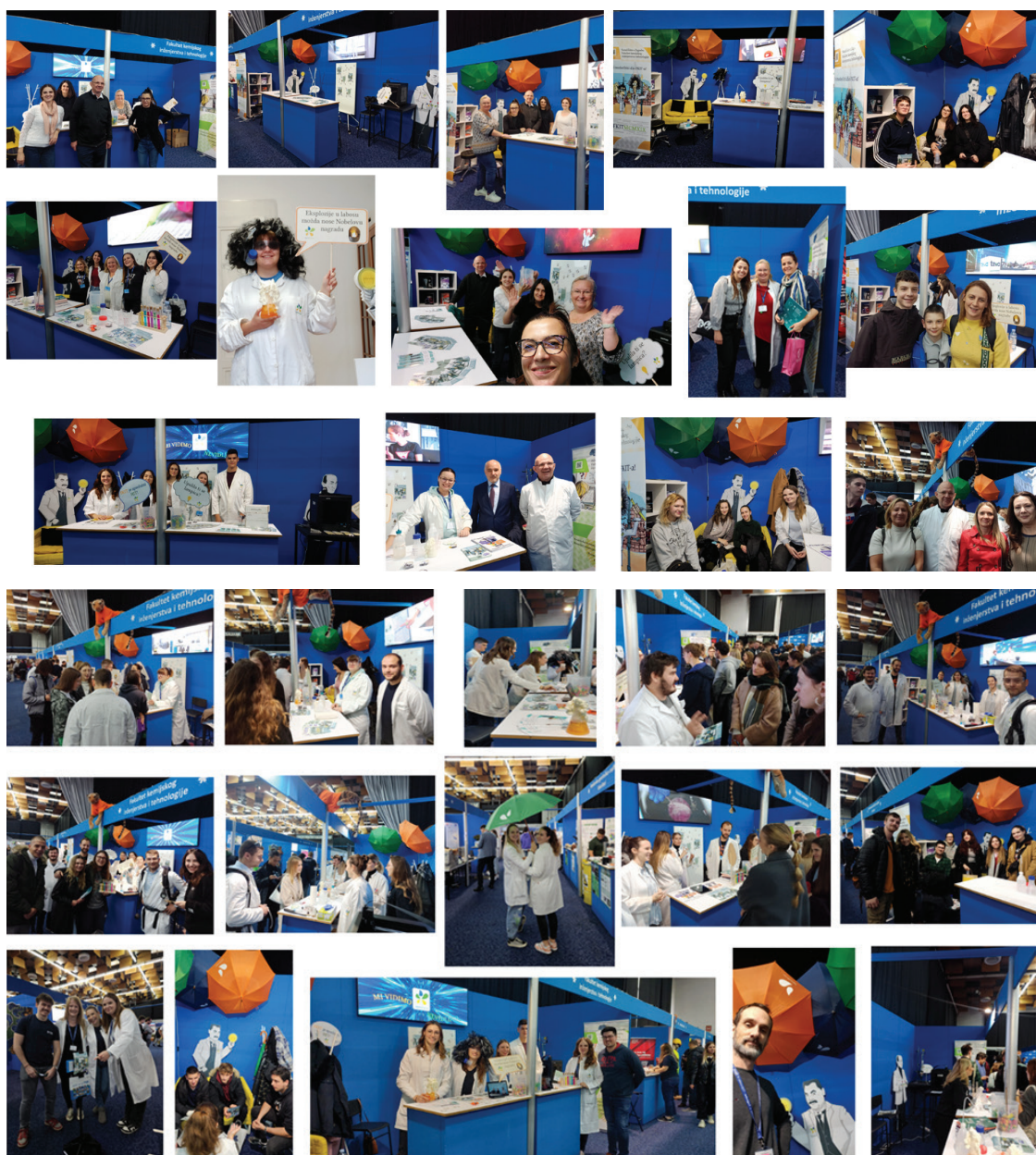
Slika 6 – Fotografije koje pokazuju ugođaj sa Smotre Sveučilišta u Zagrebu, gdje su nas posjetili učenici iz cijele Hrvatske te naši bivši studenti sa svojom djecom, našim budućim studentima

će nastaviti našim stopama te nadograđivati postojeća znanja i otkrića. Dojam o tri dana Smotre možete djelomice steći promatrajući priložene fotografije koje pršte zadovoljstvom i veseljem (slika 6). Srdačan pozdrav do 29. Smotre Sveučilišta u Zagrebu!