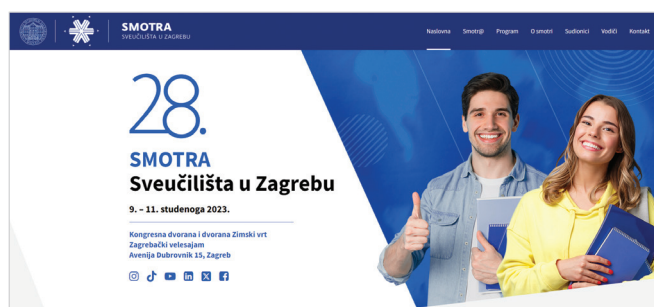
Slika 1 – Mrežna stranica 28. Smotre Sveučilišta u Zagrebu

Smotra Sveučilišta u Zagrebu (slika 1) održala se 28. put za učenike završnih razreda srednjih škola, studente i ostale zainteresirane s ciljem pravodobnog obavješćivanja o studijskim programima, dostignućima u pojedinim područjima, opremljenosti pojedinih fakulteta, nastavnim planovima, pred-diplomskim, diplomskim i poslijediplomskim studijima, kreativnim mjestima za zapošljavanje u pojedinim strukama, uvjetima smještaja tijekom studija u Zagrebu, studentskom životu i još o mnogim drugim detaljima bitnim i korisnim za studentski život. Sveučilište u Zagrebu po drugi je put organiziralo Smotru Sveučilišta na Zagrebačkom velesajmu, Avenija Dubrovnik 15, za vrijeme trajanja Interlibera ; ove godine se sve dešavalo u Kongresnoj dvorani i dvorani Zimski vrt u razdoblju od 9. do 11. studenoga. Na Smotri se predstavio 31 fakultet, tri umjetničke akademije te ostale sastavnice Sveučilišta u Zagrebu.