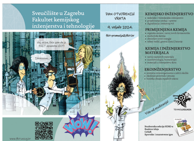
Slika 3 – Letak-pozivnica na Dan otvorenih vrata Fakulteta

Positivne energije nije nedostajalo niti jedan dan, svakodnevno su studenti i asistenti zajedno s nastavnicima dežurali na izložbenom prostoru Fakulteta uz druženje s kolegama s drugih fakulteta, gdje smo jedni drugima izlazili u susret i pomagali prilikom useljavanja i iseljavanja iz prostora Velesajma. Roboti i maskote te razni reklamni materijali razveseljavali su sve posjetitelje, ali i nas koji smo prezentirali fakultete pa se brzo stvorila suradnička