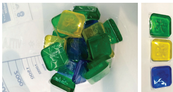
Slika 5 – Sapuni u bojama logotipa Fakulteta koji su se dijelili tijekom Smotre posjetiteljima

atmosfera među kolegama s različitih sastavnica i svi smo jedni drugima pomagali. Kroz razne kvizove, materijale i letke učili smo jedni o drugima, sve više shvaćajući da međusobno nismo konkurenti, već je svatko potreban da u postojećem sustavu na svoj način rješava specifične problematike suvremenog društva uz promišljanja o budućnosti. Ta budućnost su naši studenti, koji