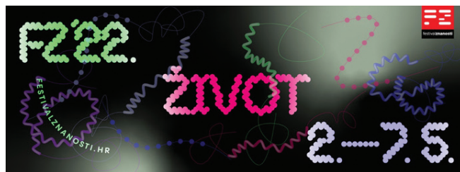
Vizual Festivala znanosti 2022.

Nadam se da je ovaj Festival znanosti s temom ŽIVOT ugradio u sve posjetitelje, uživo i online , saznanje o važnosti znanosti i znanstvenog promišljanja za svakodnevni život u svim sferama ži-