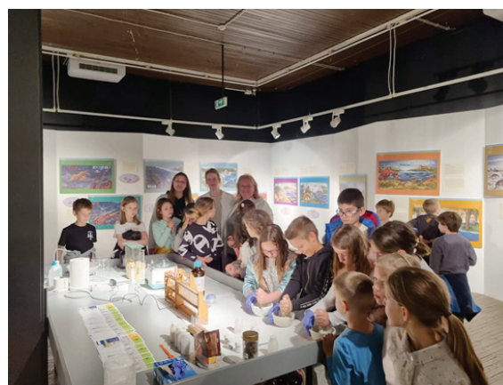
Život bez čokolade nije život!