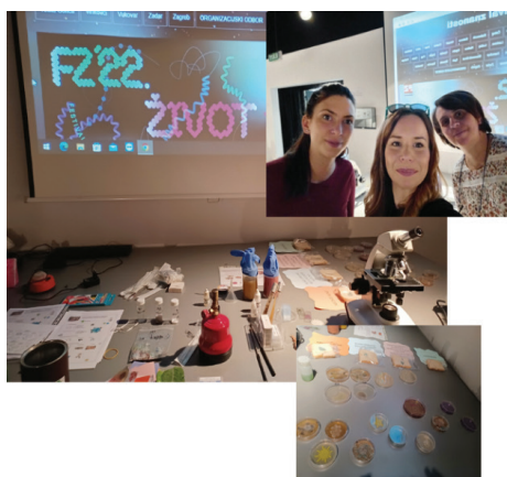
Misteriozna, mala i nevidljiva oku bića