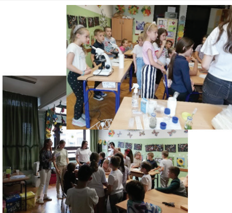
Tablica 4 – Nastavak Festivala znanosti u OŠ Rudeš kroz kapljicu vode, silikate i čokoladu