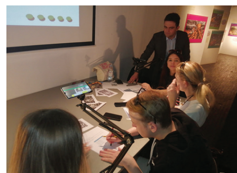
Simulacija gravitacijske sile pomoću tehnologije proširene stvarnosti