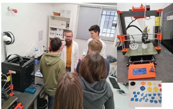
Rođenje i život nove tehnologije — 3D-ispis