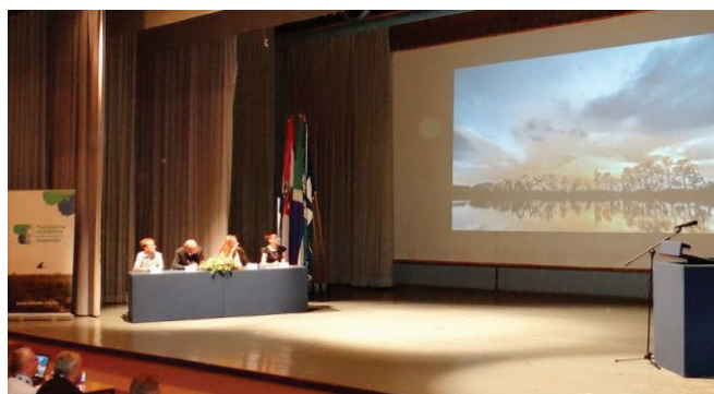
Slika 1 – Program otvaranja konferencije