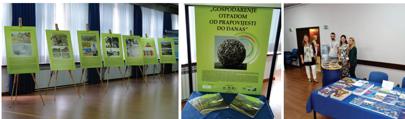
Slika 3 – Popratna događanja u sklopu konferencije