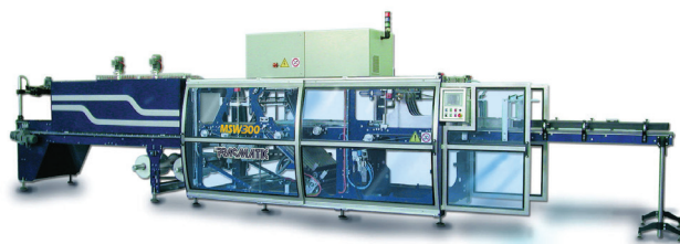
Slika 1 – Linija za pakiranje s providnom zaštitom od pristupa opasnim dijelovima. Vrata su spojena na mikroprocesor i, čim se otvore, stroj se zaustavlja.

Ovo pravilo je izuzetno važno za radnu opremu (postrojenja i uređaje). Primjeri su: zatvaranje u kućište dijelova koji se gibaju, uređaji za zaštitno blokiranje koji sprečavaju rad stroja kada nisu u funkciji zaštitne naprave, dvoručno upravljanje strojevima, zaštitne naprave s fotočelijama, zaštita od preopterećenja.