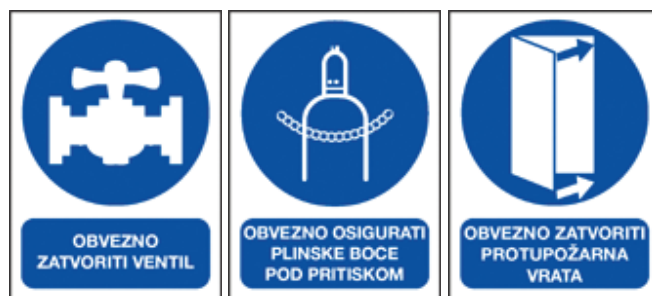
Slika 7 – Znakovi koji upućuju na pridržavanje sigurnosnih mjera.

Sigurnosni znakovi kojima se daje informacija o opasnosti ili upute o mjerama sigurnosti moraju biti postavljena na mjestima s pojavom rizika.