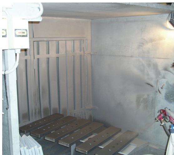
Slika 5 – Nanošenje premaza u kabini za lakiranje koja ima ugrađeni od- sis.