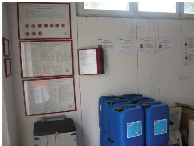
Slika 6 – Upute za rad s opasnim kemikalijama.

Tu još spada i pridržavanje posebnih radnih postupaka pri uporabi opasnih kemikalija, odnosno izloženosti fizikalnim ili biološkim štetnostima. Obvezno je u blizini takvih radnih mjesta imati opisane radne upute. Pri radu s opasnim kemikalijama na radnom mjestu moraju biti podaci o kemikaliji. Najbolje je upotrebljavati podatke iz sigurnosno-tehničkih listova.