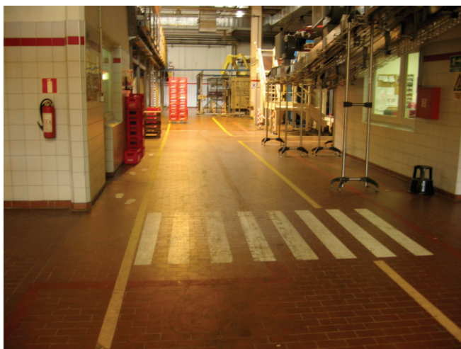
Slika 3 – Ucrteni transportni putovi.

Putovi za nuždu moraju biti slobodni i što izravniji prema sigurnom području, katovi moraju imati pomoćna stubišta, prometni putovi propisane širine, sva mjesta rada na visini većoj od 1 metar moraju imati zaštitnu ogradu 1 metar ili više i dr.