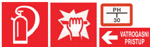
Slika 5 – Primjeri za znakove za zaštitu od požara

Uobičajeno je, a u mnogim zemljama i standardizirano, da su sva sredstva i uređaji vezani za sigurnost od požara obojeni crvenom bojom. To se prije svega odnosi na znakove sigurnosti za zaštitu od požara koji su kvadratnog oblika, a osnovna im je boja crvena. Kontrastna boja je bijela, pa su simboli i dopunski tekst ili oznake obojeni bijelom bojom na crvenoj podlozi. Znakovi moraju biti tako izvedeni da crvena boja prekriva najmanje 50 % površine znaka. Najčešće oznake na znakovima sigurnosti za zaštitu od požara su primjerice vatrogasni aparat, hidrant, ručni dojavljivač požara, vatrogasni pristup i dr.