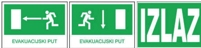
Slika 4 – Primjeri za znakove obavijesti

Po obliku, znakovi obavijesti mogu biti kvadratnog ili pravokutnog oblika, a boja koja dominira u znaku je zelena, jer ona mora prekrivati najmanje 50 % ukupne površine znaka. Kontrastna boja znaka je bijela, što znači da su grafički simboli ili tekst izvedeni bijelom bojom, a pozadina znaka je zelena. Znakovi obavijesti postavljaju se na mjesta koja se, zbog sigurnosti ili obavješavanja, moraju posebno označavati kao npr. prva pomoć, smjer za evakuaciju, izlaz itd. Kako bi se udovoljilo zakonskim propisima koji zahtijevaju organiziranu evakuaciju i spašavanje u slučajevima raznih nepredviđenih događaja, u poduzećima se izrađuju odgovarajući planovi evakuacije i spašavanja te poduzimaju određene aktivnosti. Na vidljivim mjestima, u svim objektima i pogonima poduzeća, moraju biti postavljeni shematski prikazi objekata i pogona s ucrtanim putovima za evakuaciju i mjestima okupljanja nakon izvršene evakuacije. Svi evakuacijski putovi, od najudaljenijeg radnog mjesta pa sve do izlaza na otvoreni prostor, moraju biti označeni odgovarajućim standardiziranim znakovima sigurnosti. Znakovi moraju biti vidljivi danju i noću, pa se zbog toga često izrađuju od reflektirajućeg materijala.