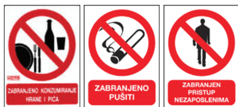
Slika 1 – Primjeri za znakove zabrane

Znakovi zabrane postavljaju se na mjesta gdje postoji opasnost za koju je propisima ili na drugi način izrečena izričita zabrana obavljanja neke radnje, kao npr. zabranjeno pušenje, zabranjena upotreba otvorenog plamena itd.