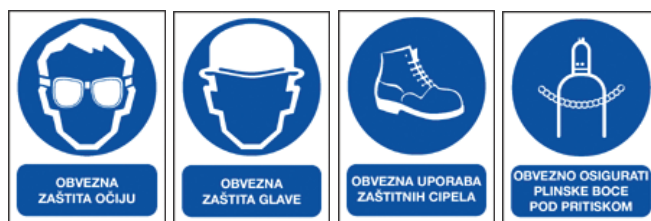
Slika 2 – Primjeri za znakove obveze

Znakovi obveze postavljaju se na mjesta gdje se opasnost ili šteta može spriječiti obveznim postupkom radnika kao npr. obvezna zaštita očiju, obvezna zaštita sluha itd.