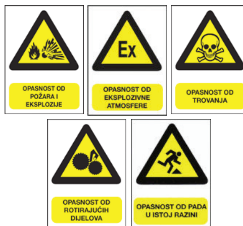
Slika 3 – Primjeri za znakove opasnosti

Znakovi opasnosti postavljaju se na mjesta gdje postoji stalna ili potencijalna opasnost od ozljeda, otrovanja, požara, eksplozije ili sl. kao npr. opasnost od eksplozivne atmosfere, opasnost od požara, opasnost od eksplozije, opasnost od električne struje, opasnost od rotirajućih dijelova itd.