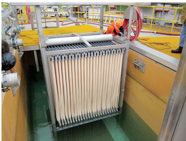
Slika 3 – Najveći novozelandski membranski bioreaktori za obradu otpadnih voda i prvi koji će upotrijebiti membrane u obliku šupljih vlakana na velikoj skali. Ti membranski bioreaktori zadovoljit će najstrože novozelandske zahtjeve za kvalitetom pročišćenih otpadnih voda. Tretira maksimalni dnevni protok od 11,3 ml/d.

Chemie Ingenieur Technik 88 (2016) 70–76