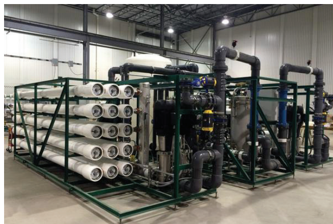
Slika 1 – Reverzna osmoza je postala najučinkovitija tehnologija za desalinizaciju i pročišćavanje vode. Primjer pogona