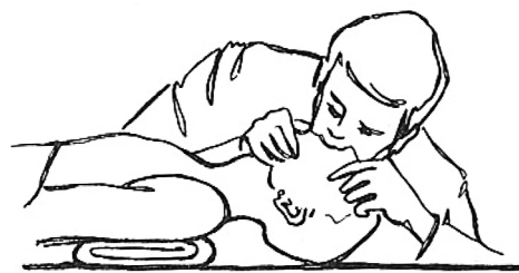
Slika 2 – Umjetno disanje metodom "usta na usta"

Osoba koja primjenjuje umjetno disanje metodom "usta na usta" mora duboko udahnuti zrak, svoja širom rastvorena usta čvrsto priljubiti na poluotvorena usta osobe i snažno izdahnuti; ako su dišni putovi bili slobodni, prsni koš osobe će se vidljivo proširiti (vidi sliku 2):