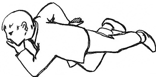
Slika 1 – Stabilan bočni položaj

Treba odmah pozvati liječnika! Osoba ne smije ležati na leđima, jer u tom položaju može doći do uvlačenja jezika i do gušenja; treba je postaviti u stabilan bočni položaj (vidi sliku 1).