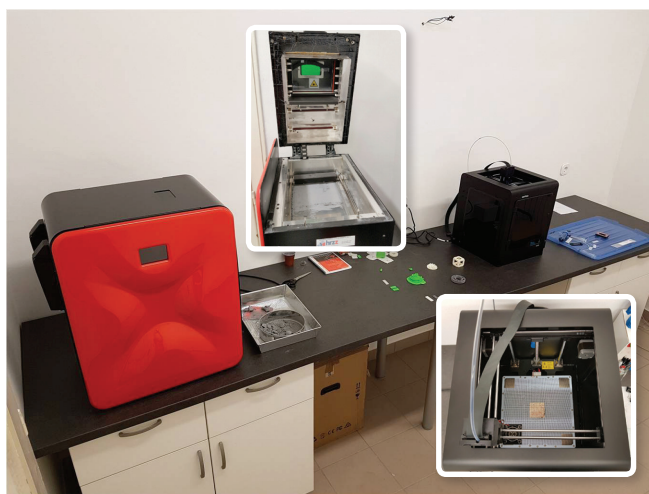
Slika 1 – Laboratorij za aditivnu proizvodnju, SLS i FDM 3D-pisači

reaktora. Budući da proces proizvodnje potrebnih dijelova traje kratko, jedan od rezultata projekta bit će i jeftina procedura za izradu protočnih uređaja. Tehnologija 3D-tiska omogućit će kemijskim inženjerima jednostavan dizajn i osmišljavanje vlastitih reaktorskih sustava pritiskom na nekoliko tipki, nasuprot dosadašnjoj proizvodnji specijaliziranih reaktora od stakla.