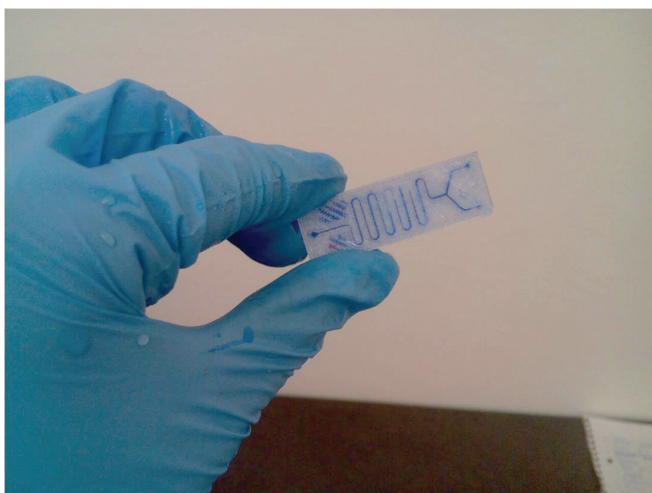
Slika 2 – Mikroreaktor izrađen tehnologijom 3D-tiska

– pisac koji radi na principu selektivnog laserskog srašćivanja – SLS (eng. Selective Laser Sintering ), djelovanjem visoke temperature lasera dolazi do povezivanja zagrijanih čestica materijala, spuštanjem podloge nanosi se novi sloj praha koji se zagrijavanjem laserom povezuje na prethodni; 3. Formlabs Form 2 – pisac koji radi na principu stereolitografije (eng. Stereolithography ), laser emitira ultraljubičastu svjetlost na sloj tekućega polimera koji uslijed toga