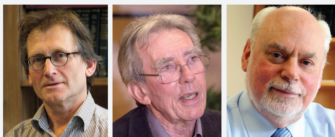
Slika 1 – Trojica ovogodišnjih dobitnika Nobelove nagrade: Jean-Pierre Sauvage, Sir James Fraser Stoddart i Bernard (Ben) Lucas Feringa.

Fig. 1 – Nobel laureates 2016: Jean-Pierre Sauvage, Sir James Fraser Stoddart i Bernard (Ben) Lucas Feringa.