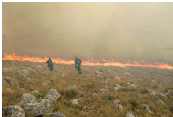
Slika 1 – Požar na Velikom Kornatu