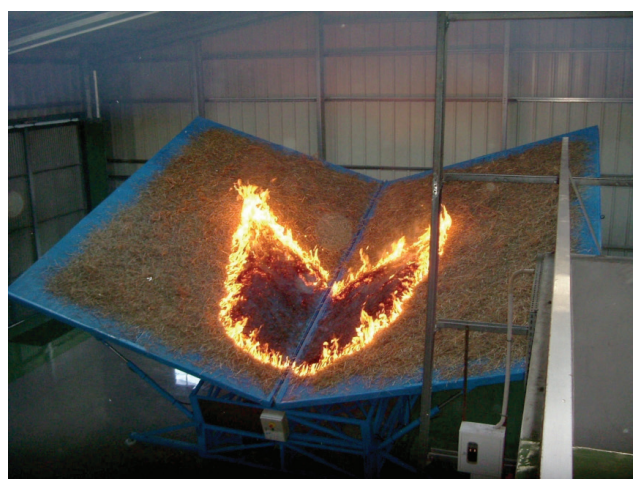
Slika 3 – Eksperiment na eruptivni požar

Za eruptivni požar posebno su važna dva faktora: konfiguracija (nagib) terena i vegetacijski pokrov. Mnogo su važniji u odnosu