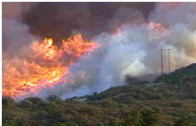
Slika 4 – Požar kod Palasca

na uvjete atmosfere ili sadržaj vlage u gorivoj tvari. Eruptivno ubrzanje može se javiti i na ravnim terenima, pri blagom vjetru koji usmjeruje plamen, stvarajući uvjete slične onima na nagnutom terenu.