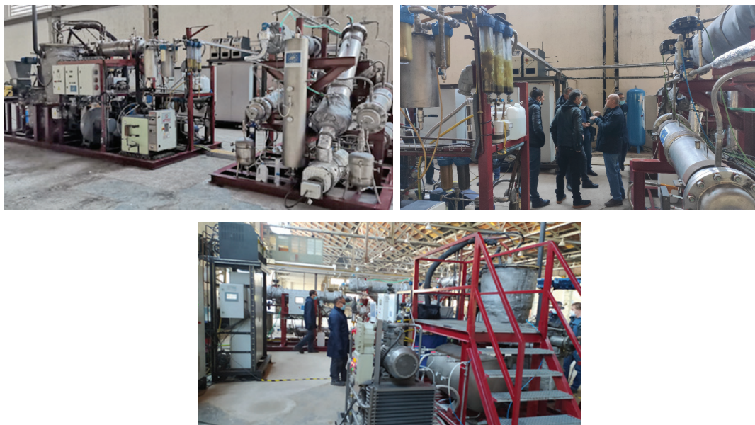
Slika 2 – Pilot-postrojenje u Rijeci

u čisti sintetski plin bogat vodikom, koji je zajedno s poznatim kemijskim postupcima sposoban proizvoditi kemikalije visoke vrijednosti (poput metilala, metanola, formaldehida i dimetil etera) po vrlo konkurentnim troškovima.