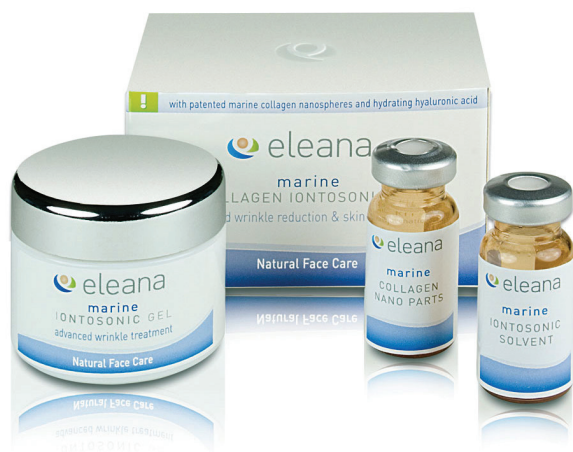
Slika 3 – Kozmetička linija Elana na bazi bioaktivnih spojeva iz morskih spužava

Daljnijim radom na projektima BIOCAPITAL (FP6-MOBILITY) i BIOMINTEC (FP7-PEOPLE) uspostavljena je multidisciplinarna mreža biologa, kemičara i IT stručnjaka s ciljem sustavne potrage za korisnim bioaktivnim spojevima iz morskih beskralješnjaka, protuobraštajnih, antibakterijskih, antiviralnih, citostatičkih te biomineralizacijskih svojstava. Najznačajniji rezultati postignuti su u području enzimatskih procesa depozicije biogenog silicija, te primjene silikateina s drugim materijalima poput titana i cirkonija. Konstruirana je i baza podataka za sve proteine uključene u proces biomineralizacije kalcijeva karbonata u metazoa. Zahvaljujući katalitičkoj aktivnosti silikateina, po prvi put su pri blagim fiziološkim uvjetima sintetizirani organometalni nanokompoziti različitih metalnih oksida sa slojevitom, tzv. Core-Shell strukturom sličnom staklastim spikulama spužava (slika 4). Time su se otvorili horizonti k mnoštvu primjena u medicini, poput zamjene ili regeneracije koštanog, hrskavičnog ili vezivnog tkiva.