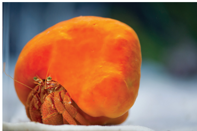
Slika 2 – Spužva Suberites domuncula (Olivi 1792.), obično obrasta puževu kućicu u kojoj je nastanjen rak samac, s kojim živi u simbiozi

Pomoću rezultata projekta SPONGES razvijena je linija kozmetičkih proizvoda (slika 3) na bazi bioaktivnih spojeva iz morskih spužava, a do predtržišne faze doveden je i novi kozmetički proizvod, Eleana – krema na bazi avarola , pogodna za iziritiranu kožu, s umirujućim i protuupalnim svojstvima. Projekt je rezultirao i značajnim napretkom u istraživanjima Crambescidin 800 i njegove potencijalne primjene u antitumorskim lijekovima.