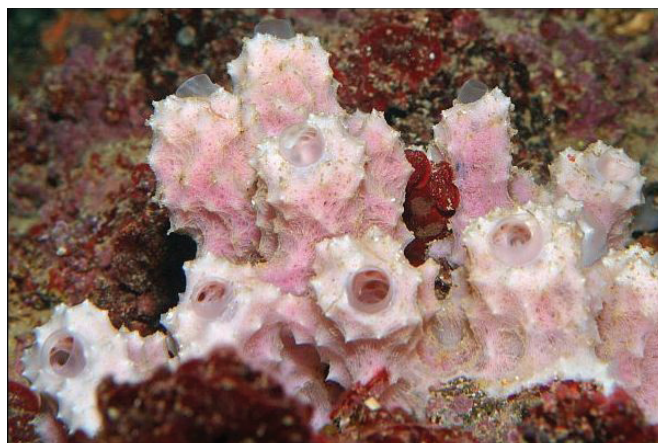
Slika 1 – Spužva Dysidea avara (Schmidt 1862.), živi u Sredozemnom moru

održive proizvodnje dvije bioaktivne komponente: avarola (izoliranog iz spužve Dysidea Avara , slika 1) i silikateina (izoliranog iz spužve Suberites domuncula , slika 2), u dovoljnoj mjeri za predtržišna istraživanja.