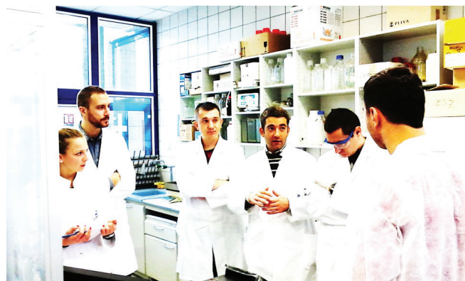
Slika 4 – Obuka inženjera i operatora pri pokretanju sustava