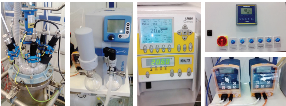
Slika 1 – Laboratorijski reaktor s vakuumskom pumpom, termostatom, dozirnim pumpama i elektro-ormarom

Regulacija temperature u šaržnom reaktoru izvedena je tako da omogućuje stabilno i kvalitetno vođenje primjenom kaskadne regulacije i standardnih načina vođenja šaržnih reaktora. Regulacijom tlaka/vakuuma, automatskim doziranjem i upravljanjem refluksnim omjerom ostvaruju se željeni uvjeti u procesu. Posebnu pažnju zahtijevala je izvedba sustava za nadzor nad cjelokupnim procesom, kontinuirano bilježenje, pohranu i grafički prikaz svih izmjerenih podataka i stanja procesa te obradu i analizu eksperimentalnih rezultata. Vođenje se provodi putem praktične računalne konzole, tzv. SCADA ( Supervisory Control And Data Acquisition ) sustava, instaliranom na osobnom računaru (PC-u). Karakteriziraju je jednostavnost i preglednost pri radu.