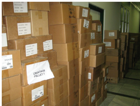
Slika 1 – Jedan dio knjiga Fondacije Sabre u kutijama na Fizičkom odsjeku PMF-a

Ovom 59., posljednjom donacijom knjiga 2013. pristigle su 8102 knjige. Dobivene knjige su eminentnih svjetskih izdavača, velik broj su izdanja novijih datuma i raznovrsnih znanstvenih područja.