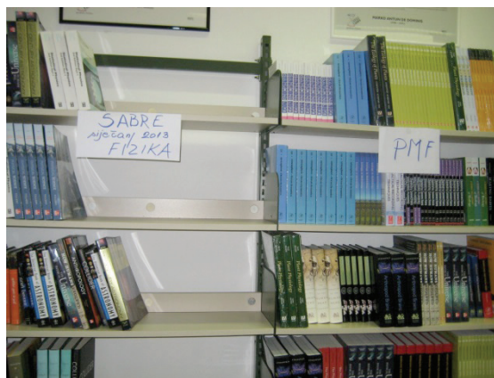
S l i k a 2 – Knjige nalaze svoje mjesto na policama