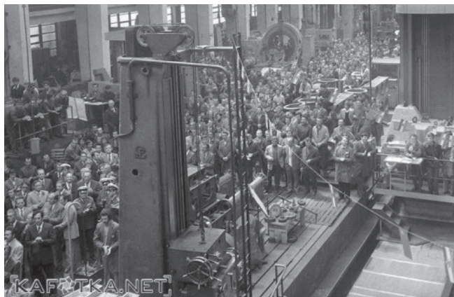
Slika 2 – Radnici Jugoturbine u pogonu