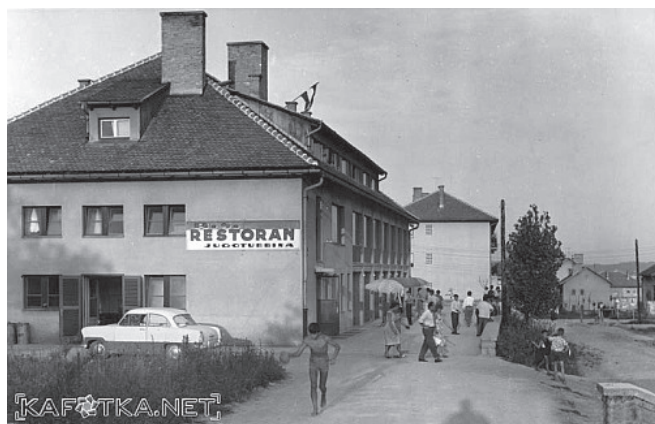
Slika 1 – Restoran u radničkom naselju na Švarči

Ako su inženjering i komercijalna sekcija bili srce/krvotok poduzeća, Institut je bio Jugoturbini mozak: tu su se donosile odluke o razvoju, koncipirao ustroj, kalibrirale inovacije, povezivala proizvodnja itd. Institut je raspolagao sa znanstveno-istraživačkim laboratorijima, računalnim centrom i bibliotekom od 10 tisuća knjižnih i 200 časopisnih naslova. Inženjeri s Instituta prenosili su znanje na polaznike Školskog metalškog centra. Poseban aspekt pozne faze Jugoturbina djelovanja bilo je izraženije eksperimentiranje s računalima, robotikom i elektronikom. Računala su Jugoturbini bila nužna zbog niza razloga. Uz temeljne poslovne obrade, evidencije i statistike, tu su važni strojarski proračuni i mogućnost pouzdanijeg i bržeg projektiranja tehnološki kom-