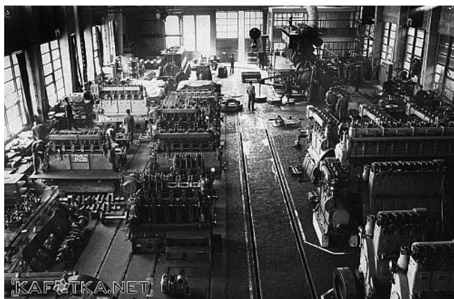
Slika 3 – Jedan od pogona Jugoturbine

Osnovica karlovačke strojgrađevno-energetske, odnosno metaloprerađivačke industrije bila je prejaka i preživjela – i prekvalitetna – da potpuno propadne. Danas u bazenu – zajedno s