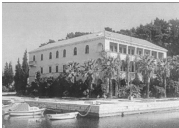
Institut za oceanografiju i ribarstvo

Institut za oceanografiju i ribarstvo Knjižnica Šetalište Ivana Meštrovića 63, 21000 Split e-mail: vucemilovic@izor.hr