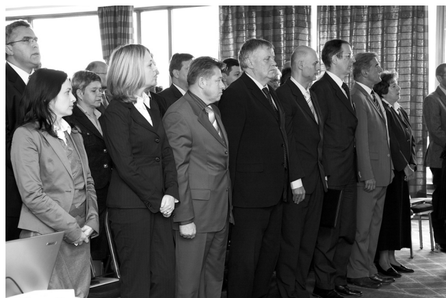
Sudionici proslave za vrijeme intoniranja Lijepa naše