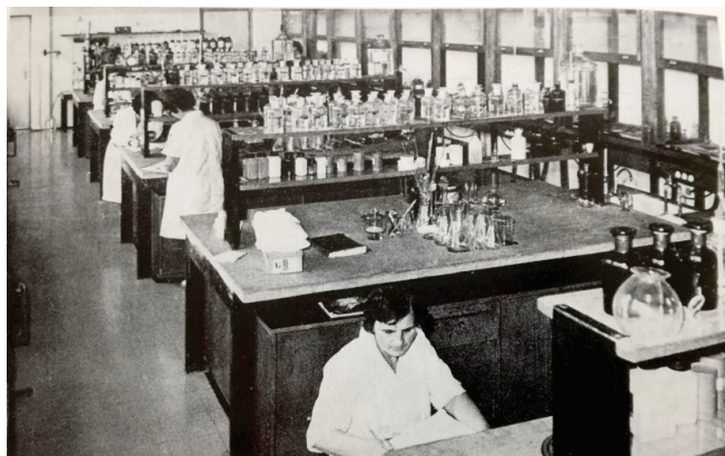
Slika 3 – Kemijski laboratorij Instituta za metalurgiju u Sisku (1970.-ih)

Sisak s računalom treće generacije UNIVAC 1106 (1972.), jednim od najvećih u bivšoj Jugoslaviji, dobivala se precizna kvantitativna analiza čelika i ostalih materijala. 16