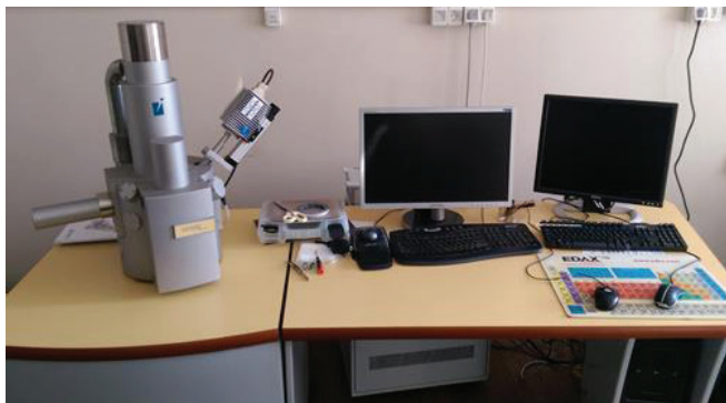
Slika 7 – Pretražni elektronski mikroskop (SEM) s energijsko disperzijskim spektrometrom (TESCAN VEGA 5136 MM) u Laboratoriju za fiziku i strukturalna ispitivanja Zavoda za fizičku metalurgiju Metalurškog fakulteta u Sisku (2010.)

Fig. 7 – Scanning electron microscopy (SEM) with energy dispersive spectroscopy (TESCAN VEGA 5136 MM) at the Physics and Structure Testing Laboratory, Physical Metallurgy Department of the Sisak Faculty of Metallurgy (2010)