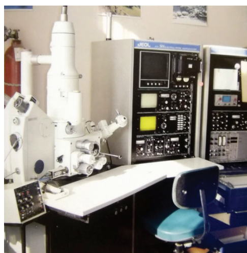
Slika 4 – Pretražni elektronski mikroskop (SEM JEOL JXA 50 A) s valno disperzijskim spektrometrom (WDS) Instituta za metalurgiju (od 2002. je na Metalurškom fakultetu u Sisku)