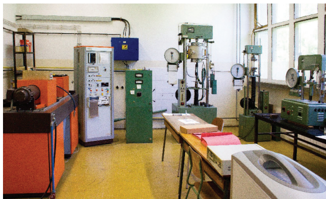
Slika 8 – Oprema Laboratorija za obradu kovina deformiranjem Zavoda za mehaničku metalurgiju Metalurškog fakulteta u Sisku (2010.)

Od 2001. godine stručne aktivnosti Metalurškog fakulteta u polju metalurgije odvijale su se putem šest ugovorenih