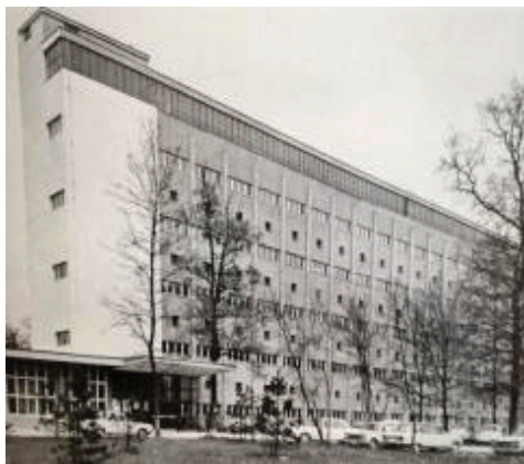
Slika 2 – Glavna zgrada Instituta za metalurgiju u Sisku (1970.-ih) Fig. 2 – Main building of the Sisak Institute for Metallurgy (1970s)

znanstveno-istraživački rad iz polja metalurgije SR Hrvatske, surađujući s ostalim institutima. Prvih godina Institut se "uhodavao" u radu, pojavili su se problemi s kadrovima (posebno s visokostručnim), nedostatkom znanstveno-istraživačke opreme, ali i nedostatkom prostora.