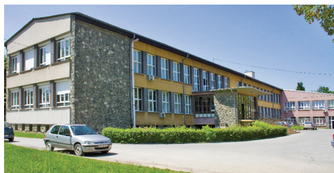
Slika 1 – Glavna zgrada Metalurškog fakulteta u Sisku (2010.) Fig. 1 – Main building of the Sisak Faculty of Metallurgy (2010)