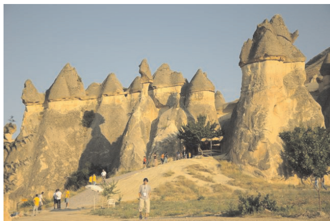
Slika 1 – Kapadokija: neobične formacije pješčenjaka pod kapama od bazalta

Dakle, prvo podsjetimo na neke činjenice iz geografije i povijesti koje smo mi kao prirodoslovci možda zaboravili. Turska je s hrvatskog gledišta velika zemlja, s površinom od 780 000 km 2 veća je od Hrvatske oko 14 puta. Broj stanovnika (74 milijuna) također je bitno veći nego u Hrvatskoj (više od 16 puta). Rasprostire se na dva kontinenta (3 % u Europi) i ima kopnene granice s Gruzijom (252 km), Armenijom (268 km), Azerbejdžanom (9 km), Iranom (499 km), Irakom (352 km), Sirijom (822 km), Grčkom (206 km) i Bugarskom (240 km). Većim se dijelom nalazi na Anadoljskom poluotoku (kod nas poznatom kao Mala Azija), između Crnog, Marmornog, Egejskog i Sredozemnog mora. Geološki je to područje uzdizanja tla u sudaru afričke i azijske ploče. Najviši je vrh Ararat (5166 m). Ima tu vulkana, česti su potresi i postoje zanimljive geološke formacije kao što su Kapadokija i Pamukkale (slike 1 i 2).