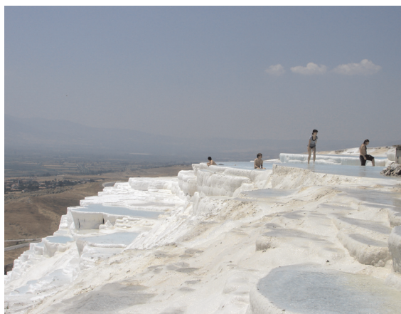
Slika 2 – Pamukkale: travertinske terase nastale taloženjem aragonita iz tople mineralne vode