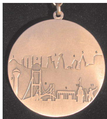
Slika 6 – Poledina medalje s IChO 2011 – Brojevima označene znamenitosti opisane su u tekstu

Svi znamo da medalje imaju dvije strane i osvojene medalje ljepše je pogledati u časopisu Priroda 4 ili na internetskoj adresi HKD-a 1 jer se vide u boji. Prednja strana redovito ima logo same olimpijade ili grbove društva ili sveučilišta domaćina, a poledine sadrže nešto čime se zemlja domaćin posebno ponosi. Najčešće su to doprinosi iz kemije, ali ne nužno. Na primjer, na poledini medalje 40. olimpijade u Budimpešti bio je prikazan model molekule vitamina C koji je otkrio i prvi izolirao mađarski kemičar Albert Szent-Györgyi, na medalji 41. olimpijade u Cambridgeu prikazana je struktura dvostruke zavojnice DNA koju su riješili F. Crick i J. D. Watson u Cambridgeu, a na poledini medalje 42. olimpijade održane u Tokiju prikazano je japansko sveto brdo Fuji i nacionalni cvijet glicinija ( Wisteria floribunda ).