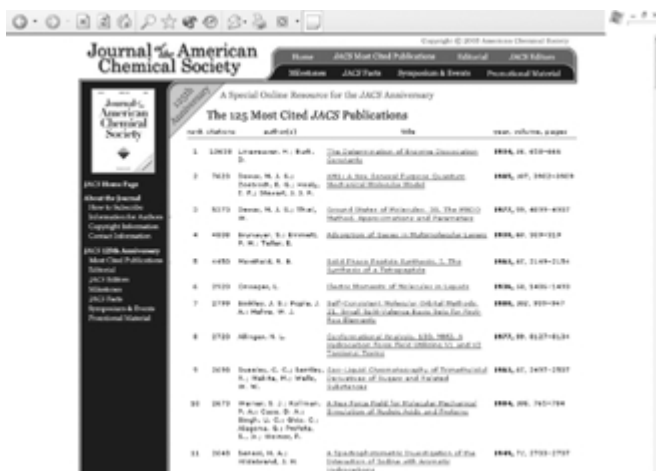
The 125 Most Cited JACS Publications

Vrijedi spomenuti da je najcitiraniji rad H. Lineweavera i D. Burka "The determination of enzyme dissociation constants" objavljen na stranicama 658–666 u 56. volumenu iz 1934 g., a citiran je do danas ukupno 10638 puta.