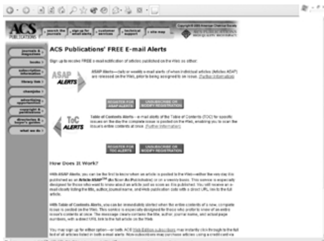
ACS Publications' FREE E-mail Alerts

Treba svakako navesti velike mogućnosti pretraživanja časopisa ACS-a. Pretplatnici na mrežna izdanja mogu pretraživati ono što je dostupno u digitalnom obliku. No i oni koji nisu pretplatnici na mrežna izdanja časopisa ACS-a ipak mogu pretraživati sadržaje časopisa.