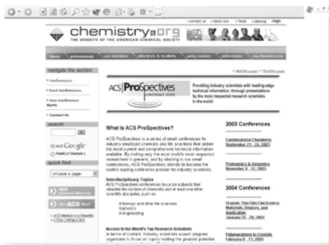
Početna stranica Chemistry.org

Na internetskoj stranici http://www.chemistry.org nalazi se mjesto na internetu možda najutjecajnijeg strukovnog udruženja u području kemije American Chemical Society. Iako su informacije koje se na ovom mjestu mogu naći ponajprije namijenjene članovima toga društva, i kemičari izvan njega mogu tu naći štošta zanimljivo. A prva je zanimljivost vezana uz naoko malu razliku koja ACS dijeli od dobrog dijela drugih takvih društava. Naime, već pri prvom pogledu na početnu stranicu uočava se njegova orijentiranost ponajprije prema profesionalcima zaposlenima u industriji.