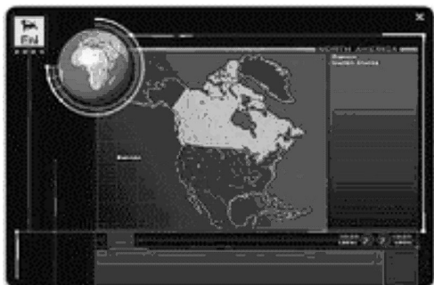
ENI: The World Energy Atlas

Također, ista stranica nudi i koristan popis literature sa sažecima za one koji žele detaljnije informacije o energetskej problematici. Nadalje, od drugih korisnih sadržaja izdvajamo i glosar s 5000 pojmova namijenjen olakšavanju razumijevanja terminologije koja se primjenjuje u naftnoj industriji te tablicu za konverziju različitih energetskej jedinica.