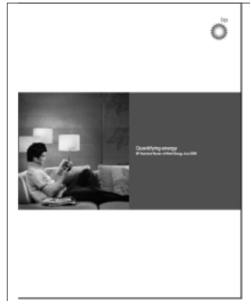
BP: Statistical Review of World Energy , 2006

Uz nju, na tim se stranicama može doći i do The World Energy Atlas , koji donosi najvažnije ekonomske i energetske pokazatelje za 140 zemalja svijeta. Karte u tom atlasu donose povijesni pre-