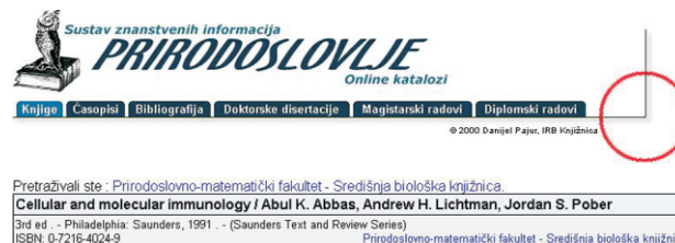
Slika 2 – Primjer pretraživanja fonda SBK putem centralnog kataloga podsustava Prirodoslovlje

Središnja biološka knjižnica je članica projekta Ministarstva znanosti i tehnologije Sustav znanstvenih informacija RH – podsustav Prirodoslovlje , čiji je cilj približiti knjižnice korisnicima putem računala, osiguravajući im brz i jednostavan pristup informacijama. Stoga se dio fonda knjižnice može pretražiti putem centralnog kataloga Podsustava.