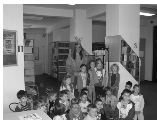
Slika 5 – Indijanac i gosti iz vrtića na punktu Knjižnice 2010.

2004. Od tiskane knjige do digitalne knjižnice – Nekoć opipljiva knjiga sada je digitalno znanje u virtualnom svijetu. Internet je povezoao knjižnice u veliku svjetsku knjižnicu bez zidova.