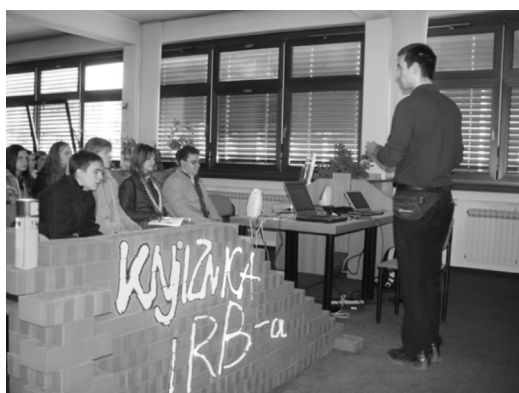
Slika 3 – Punkt Knjižnice na Otvorenim danima 2005.