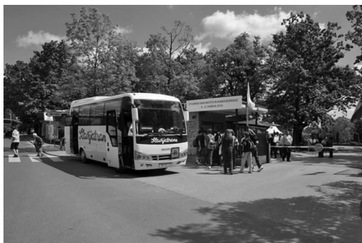
Slika 1 – Jedan od mnogih autobusa punih školaraca na Otvorenim danima IRB-a 2010.

Već uigrani organizacijski odbor (u cjelokupnoj organizaciji sudjelovalo je oko 250 djelatnika IRB-a) i ove se godine svojski potrudio da svim posjetiteljima omogući ugodan i zanimljiv boravak na Institutu. Program je bio namijenjen u prvom redu učenicima, studentima i građanstvu. Pozivi i promotivni materijali, poslani školama mjesecima ranije, rezultirali su vrlo brzo dupkom punim rasporedom grupnih obilazaka, a dobra medijska popraćenost prijavila je i zainteresirane građane.