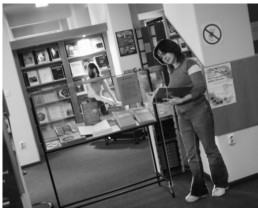
Slika 2 – Uređenje Knjižnice tijekom Otvorenih dana 2004.