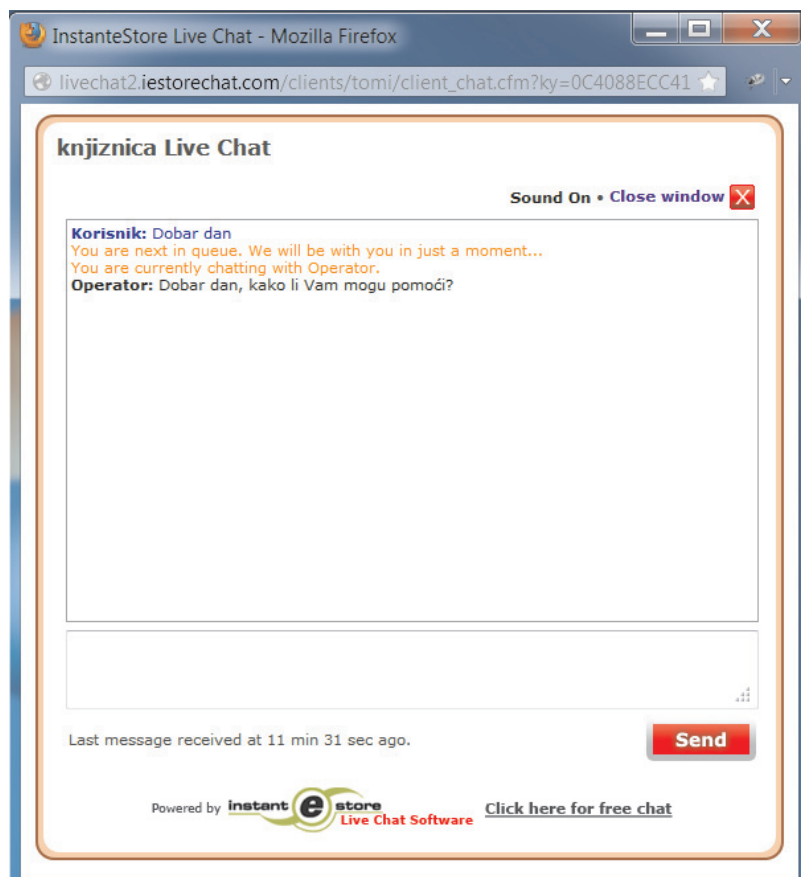
Slika 3 – InstanteStore Live Chat – korisničko sučelje

odnosno knjižničarom (slika 2). Kako bi započeli s radom, operateri moraju samo izvršiti proces registracije. Operatersko sučelje pruža djelatnicima uvid u broj korisnika koji čeka u redu na odgovor i za svakog korisnika prikazuje njegovo vrijeme čekanja. Razgovor se vrši u prozoru koji prije nego li se prikaže upozori operatera da ima novog korisnika na čekanju te ga pita želi li ga prihvatiti.